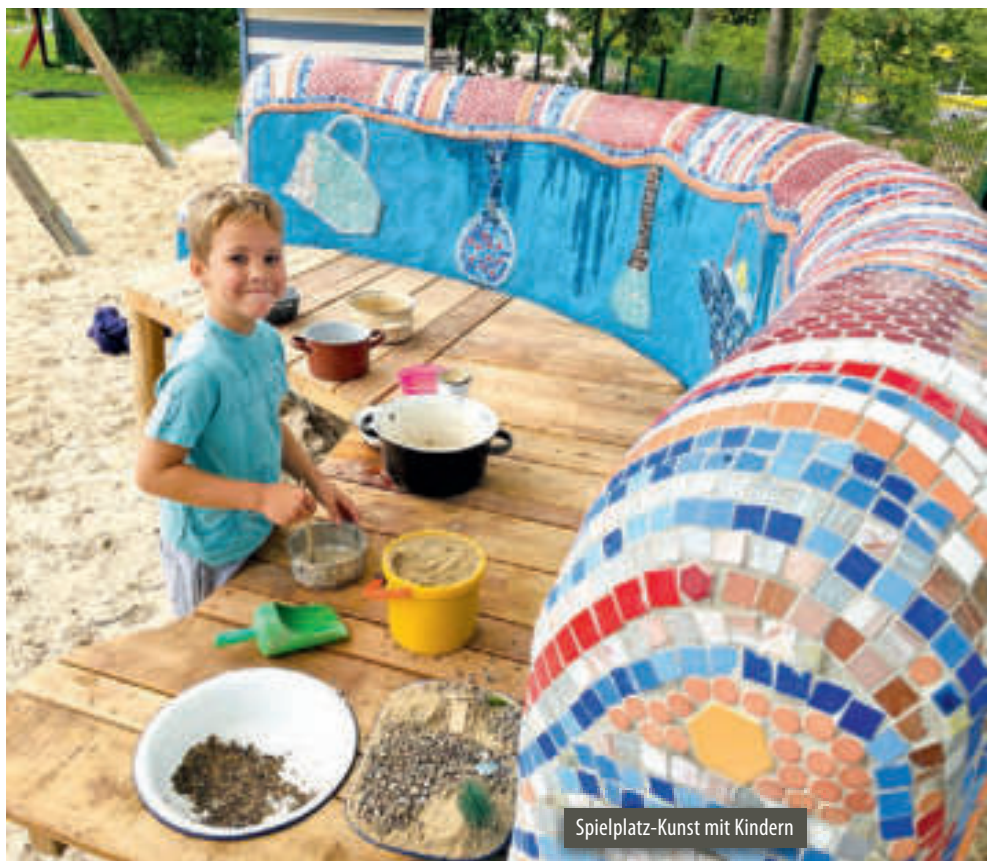
Spielplatz-Kunst mit Kindern