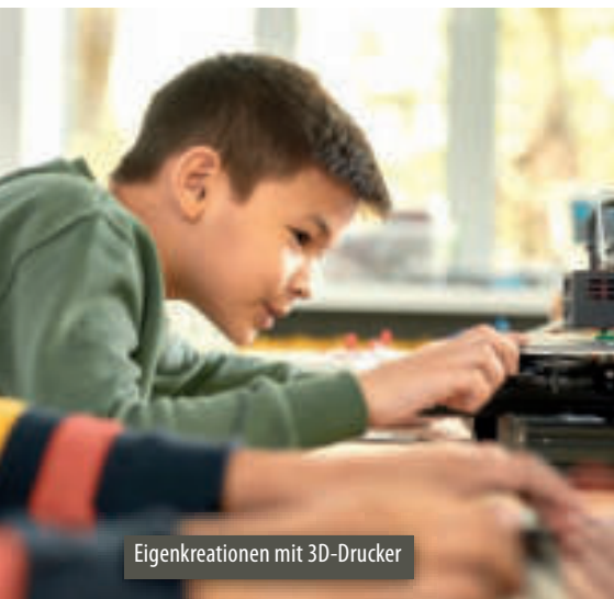
Eigenkreationen mit 3D-Drucker

heitliche Bedienung erschweren. Deshalb vermittele ich den Kindern, wie sie die Philosophien hinter den verschiedenen Bedienkonzepten erkennen können, und gebe auch individuelle Hilfestellung zur Orientierung.